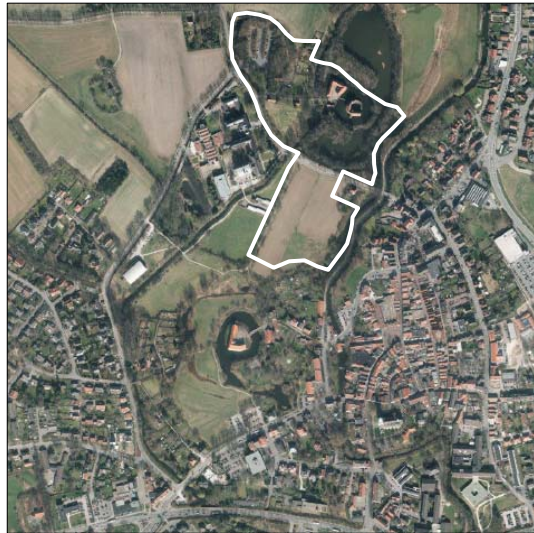
Luftbild (nicht maßstäblich)