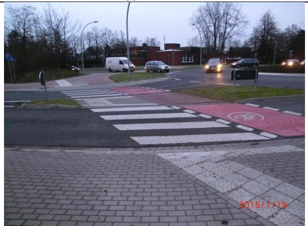
Bild 4: Kreisverkehr Valve / K. Adenauer-Str. 4,5m Abstand Furt - Fahrbahn