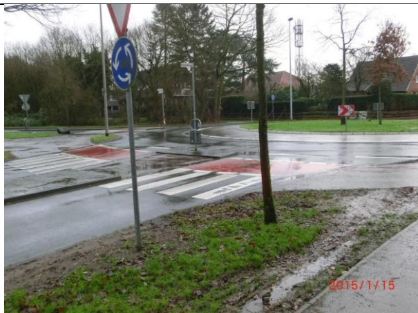
Bild 5: Kreisverkehr Münster – Hiltrup 1,0m Abstand Furt - Fahrbahn