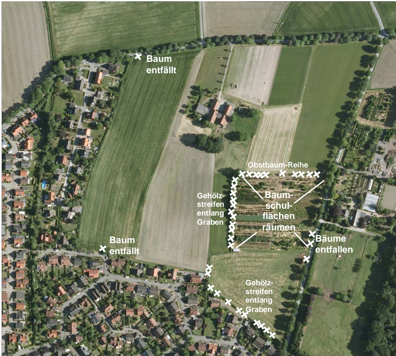
Luftbild: (nicht maßstäblich)