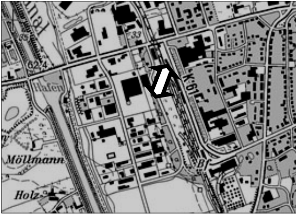
Lageplan (nicht maßstäblich)