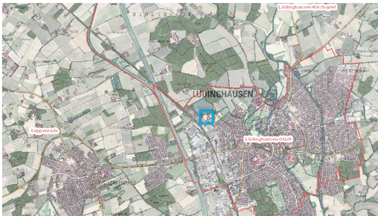
Abbildung 1: Lage im Stadtgebiet