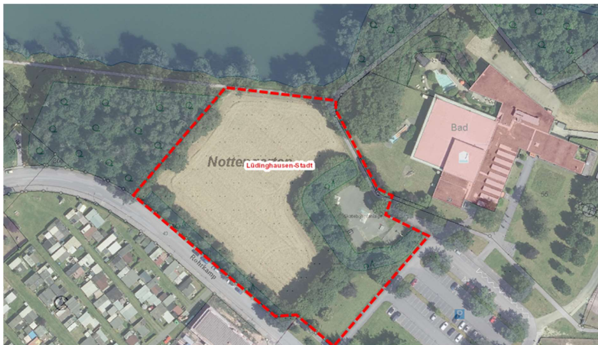
Abbildung 2: Abgrenzung und Realnutzung des Geltungsbereichs (rot)