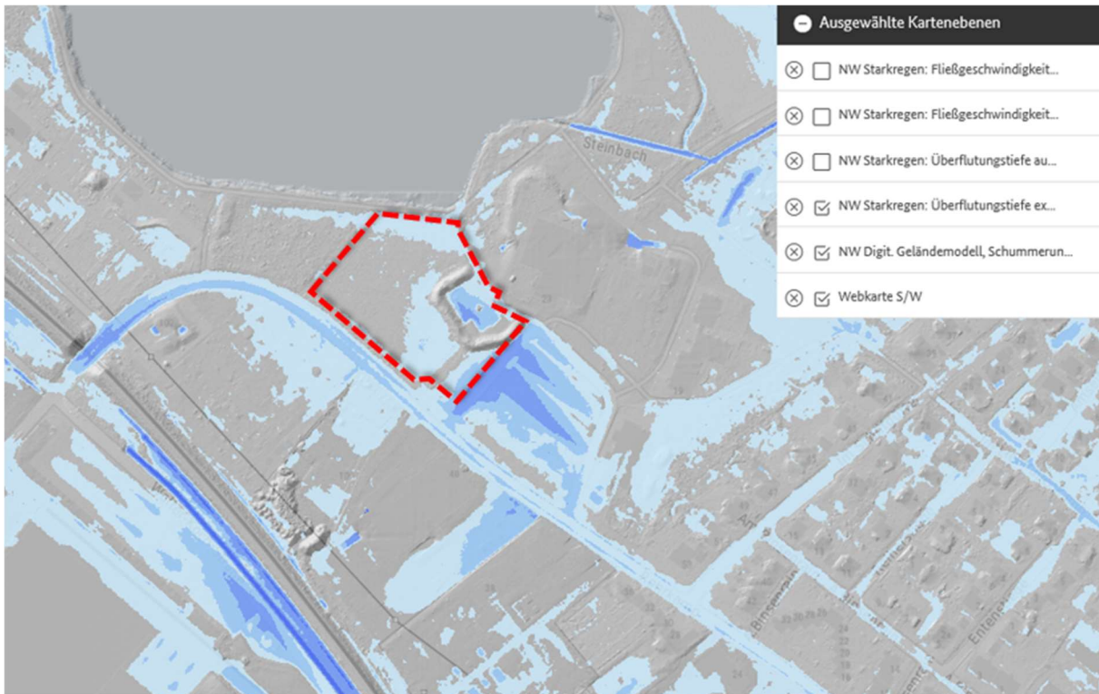
Abbildung 5: Auszug aus der Starkregenhinweiskarte für ein extremes Ereignis (BKG 2021)

Für die Belange des Hochwasserschutzes, insbesondere der Sicherung von Retentionsräumen, kommt dem Plangebiet keine Bedeutung zu. Bei bewusster Festsetzungstechnik (Lenkung der Versiegelung etc.) im nachfolgenden Bebauungsplan ist nicht von einer Erhöhung der Gefahr durch Starkregen auszugehen. Auch die Neubildung stark wasserführender Fließwege ist darüber hinaus nicht anzunehmen.