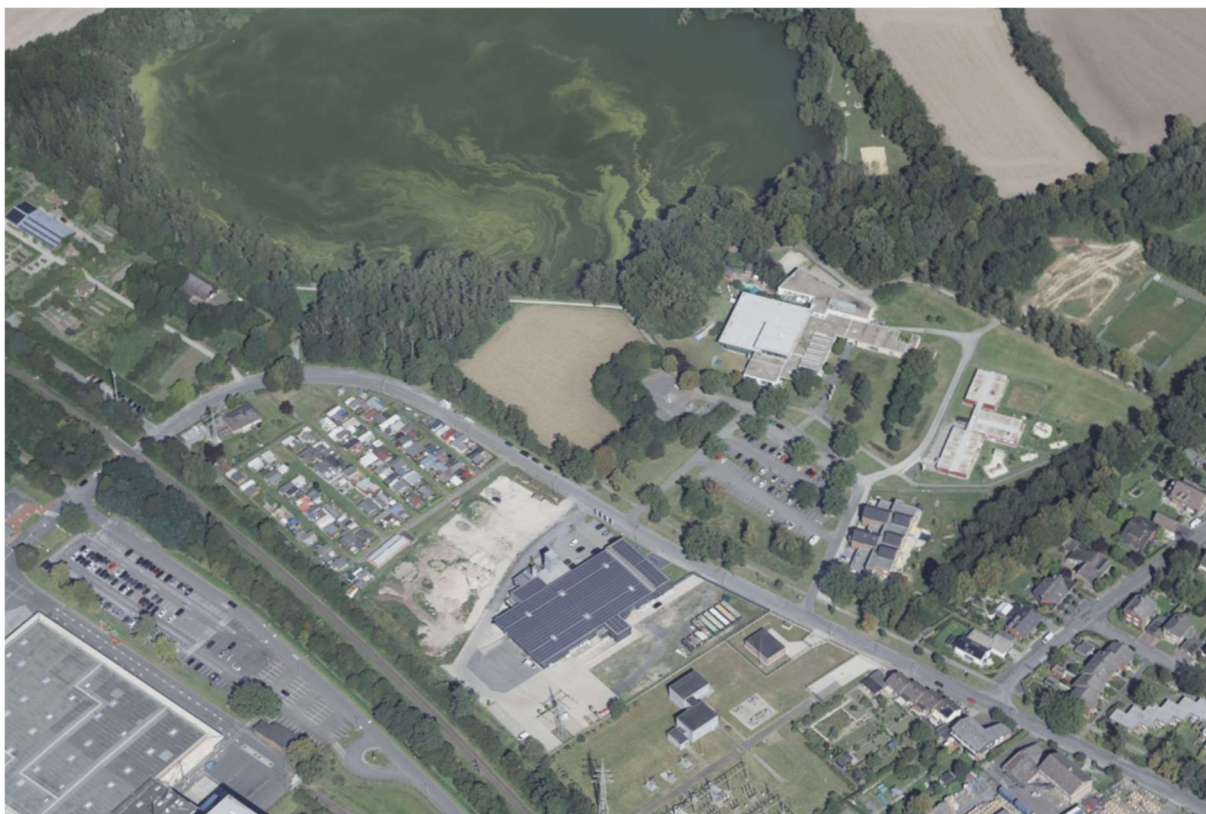
Abbildung 3: Schrägluftbild der Bestandsnutzung (Blickrichtung Ost)